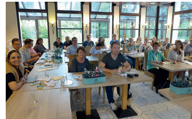
Hotel Engel | Wintergarten

Tel.: +49 40 554-26 0 Fax: +49 40 554-26 500 mail@hotel-engel-hamburg.de www.hotel-engel-hamburg.de